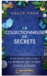
La collectionneuse de secrets