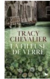
La Fileuse de verre