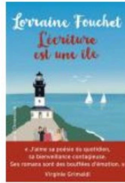
L'écriture est une île